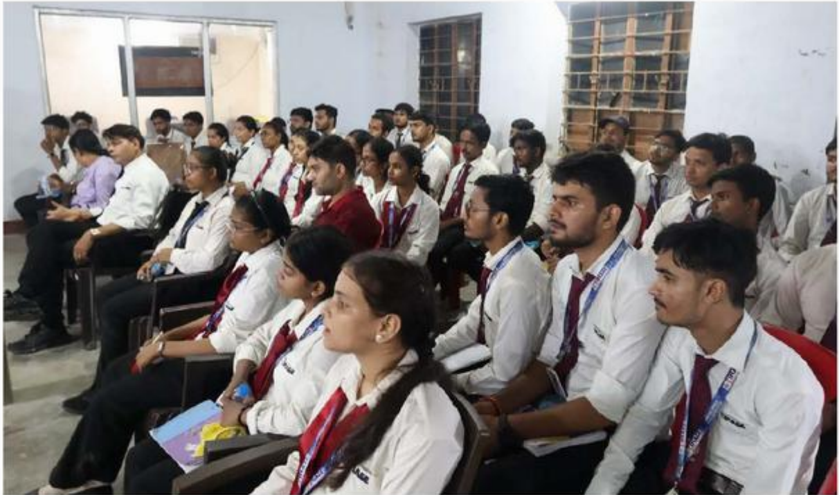
'Green Polytubes' द्वारा 'The Psychology behind Entrepreneurial Motivation and Persistence' विषय पर आयोजित वर्कशॉप को अटेंड करते छात्र।

साथ ही यहाँ पर छात्रों ने विभिन्न प्रकार की पाइप्स जैसे SWR Pipes, Casing Pipes, Plumbing Pipes के प्रोडक्शन के बारे में जानकारी प्राप्त की। वहाँ इन्होंने उनके मैन्युफैक्चरिंग प्रोसेसेज को देखा और समझा। छात्रों ने इस प्रॉडक्ट की मैन्युफैक्चरिंग, मार्केटिंग, डिस्ट्रीब्यूशन इत्यादि के कॉन्सेप्ट के बारे में जानकारी प्राप्त की। छात्रों से बात करते हुए उन्होंने बताया कि किस प्रकार से उन्होंने इंडस्ट्री की स्थापना की - किस प्रकार की चुनौतियाँ आईं - और किस प्रकार से उन्होंने इन चुनौतियों का सामना किया और सफल हुए। छात्रों ने प्लास्टिक के स्ट्रेंथ या फ्लेक्सिबिलिटी को बढ़ाने के लिए - निर्माण में किस तरह के केमिकल कंपोजिशन से इत्यादि का इस्तेमाल किया जाता है - इसकी भी पूरी जानकारी प्राप्त की। छात्रों ने इनके निर्माण की प्रक्रिया को देखा प्रोसेसेस को समझा तथा मार्केटिंग स्ट्रैटिजी के बारे में भी जानकारी ली।